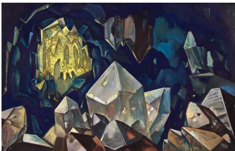
Н.К. Рерих "Сокровенное (Сокровище горы)" 1933 г.

Пиши друг. Друзья, в этот день надо вспомнить всех тех, кто к Свету стремится, о тех, кто внизу, и тех, кто вверху, дабы объединить всех, стоящих на Лестнице Света, и привет им послать, далеким и близким (друзьям). Слово друг и друзья заменяет Нам слово другое. Одно от будущего, другое — от прошедшего. Мы идем в будущее, и слово друг и друзья пусть будет нам словом, зовущим под Знамя Владыки, под Знамя дружбы и единства всех народов Земли в Свете Владыки Майтрейи. [5]