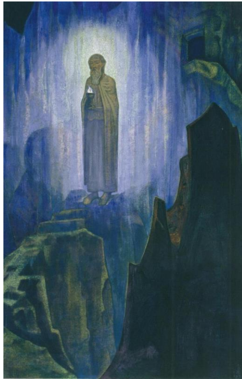
Н.К. Рерих "Lumen Coeli (Свет Небесный)". 1931 г.